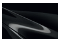
Jet Black MC