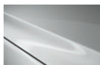
Arctic White CLE