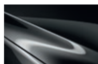
Machine Gray M