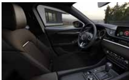
Материал обивки салона - кожа Nappa