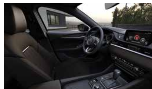
Материал обивки салона - кожа Nappa