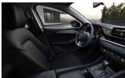
Материал обивки салона - ткань