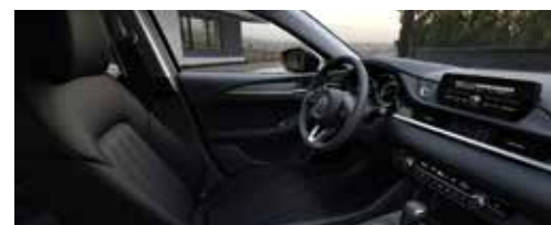
Материал обивки салона - ткань