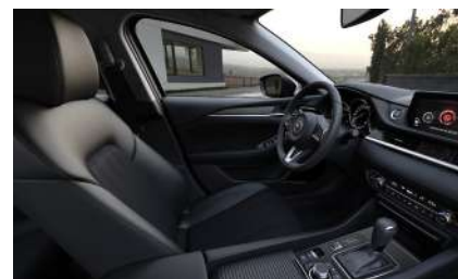
Материал обивки салона - кожа