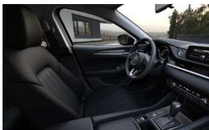
Материал обивки салона - ткань