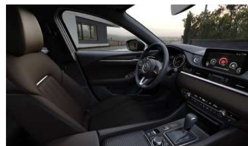
Материал обивки салона - кожа Nappa