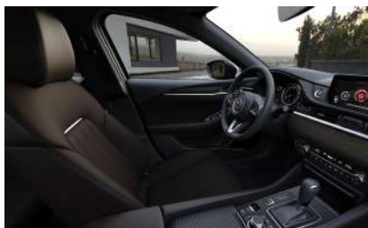
Материал обивки салона - кожа Nappa