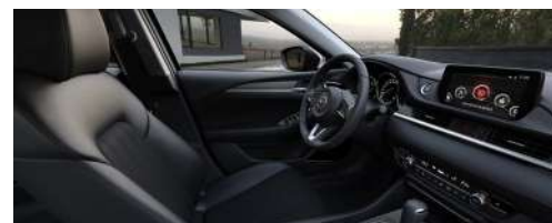
Материал обивки салона - кожа