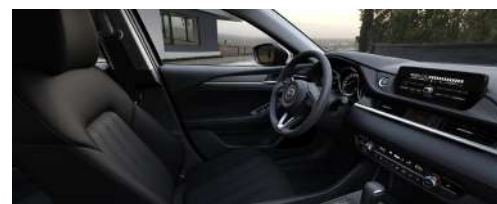
Материал обивки салона - ткань